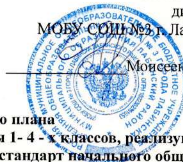
Таблица-сетка часов учебного плана МОБУ СОШ №3 г. Лабинска Лабинского района для 1- 4 - х классов, реализующих федеральный государственный образовательный стандарт начального общего образования в 2015- 2016 учебном году.